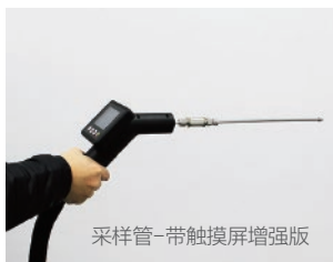
采样管-带触摸屏增强版